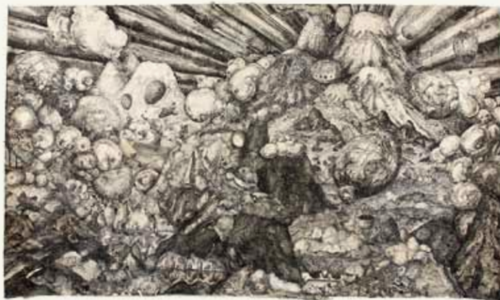
「ほの暗き日」2007年/299x483cm/和紙、墨、胡粉

いしへの火山爆発によって形成された肘折カルデラ。気鋭の日本画家・三瀬夏之介は、この夏、肘折の湯守たちに案内されて、その外輪山をぐるりと巡り歩いたという。「辺りを散策するなかで、脳裏にはいつも肘折のすべての原点である1万年前の火山噴火が幻想のように映っていた」と語る画家は、そのとき印象に刻み込まれた「肘折幻想」を屏風に墨で描いた。閉鎖されたほの暗い旧郵便局舎で、火山の爆発により立ちのぼる水蒸気が、温泉の湯気に変化していくという、ダイナミックな肘折山水が展開する。