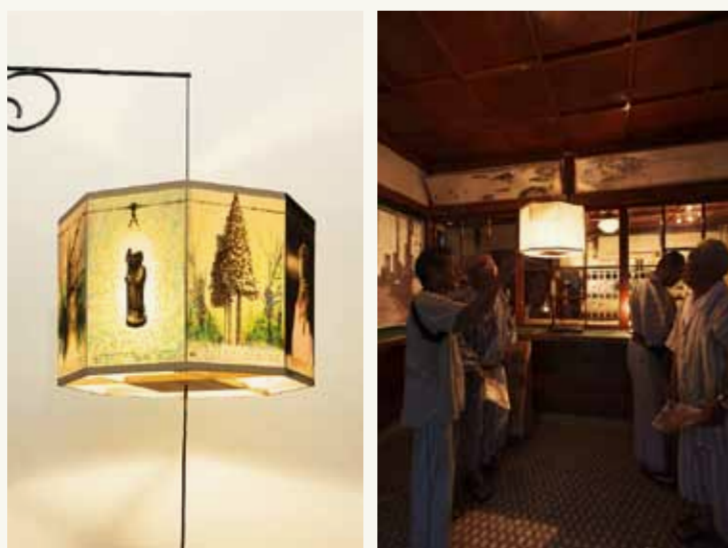
左=「ひじおりの灯」灯籠絵: 若月公平/灯籠デザイン: 竹内晶貴(みかんぐみ) 右=「ひじおりの灯」2009 肘折温泉旧郵便局舎内での点灯風景

夏の風物詩としてすっかり定着した八角の灯籠「ひじおりの灯」が、地区からのアンコールを受けて、この秋ふたたび3日間限定で点灯する。36基の灯籠絵は、東北芸術工科大学でアートやデザインを学ぶ43名の若者たちが、温泉街での逗留制作を経て描きあげたもの。山菜や旅館の景観、浴衣姿の湯治客や朝市の様子、同地の伝説や妖怪奇譚の類、月山信仰に基づく様々な儀礼、銅山川を流れる雪解けの水音など、有形無形の肘折的小宇宙を描いた作品が、夜の温泉街にずらりと並ぶ。